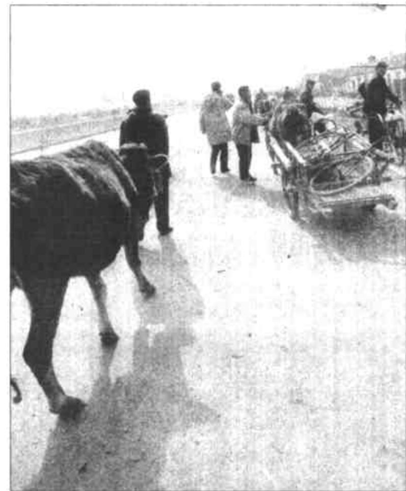
集散了，买到牛的主儿得意洋洋地牵回家去，没成交的牛依然被主人套上车，刚要上路时，隐约听见“牛经纪”们在喊：“喂——回来……。”

传统的交易方式是“牛经纪”们的法宝，不用言语，握握手便各心中有数，市场上每头牛的价格，大都在这种无声的交易中决定了。