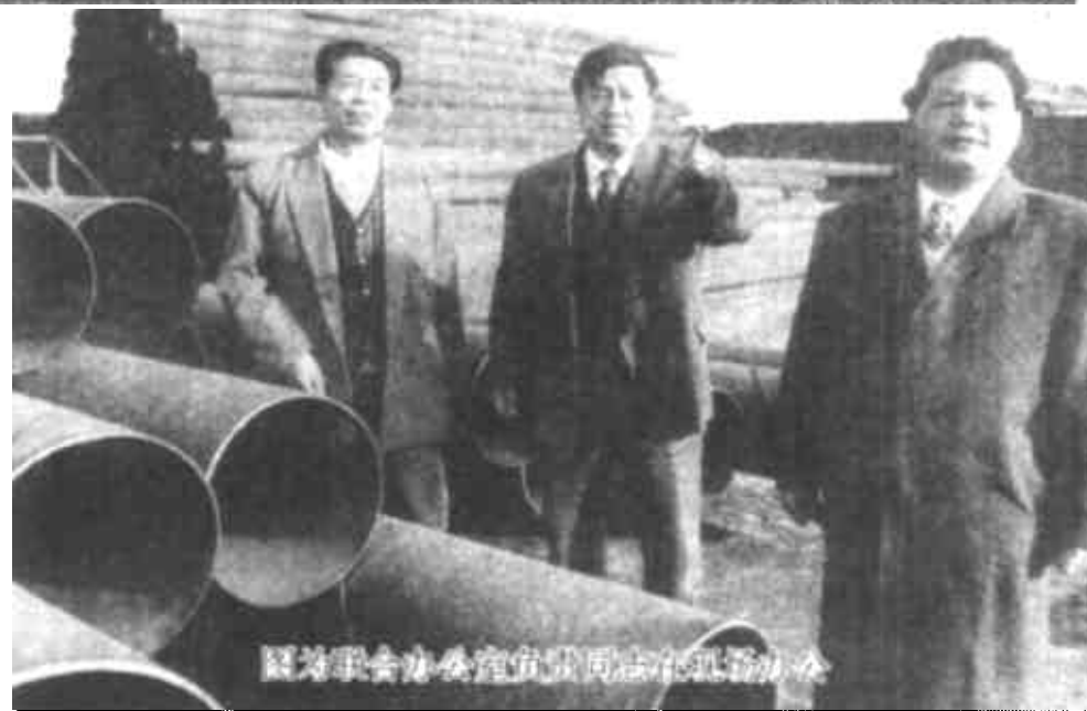
市废旧金属市场联合办工作人员在视察市场

去年，市废旧金属市场遵照市人民政府办公室有关通知精神，在市物资总公司的支持领导下，市场全体工作人员共同努力，取得了有目共睹的佳绩。目前进入市场的经营户有15家，从业人数达200余人，安置物资系统下岗职工40人，盘活土地27000平方米，利用闲置房屋1440平方米。完成总交易额、销售额4500万元，上交税金50万元。