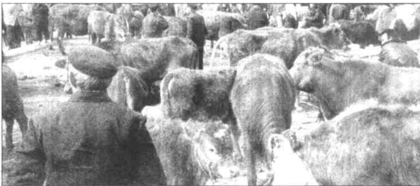
牛市上，牛的主人等待着成交后的新主人。

传统的交易方式是“牛经纪”们的法宝，不用言语，握握手便各心中有数，市场上每头牛的价格，大都在这种无声的交易中决定了。