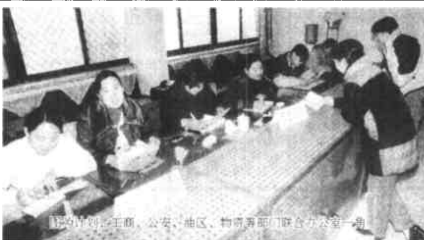
联合办工作人员在油田联合办办公室

由市计委、市工商局、市公安局、油地两油区办组成的市场联合管理办公室。在工作中，积极配合主办单位开发发育市场，努力协调市场有关部门及油田有关单位的关系以及市场与其他企业的关系。实行统一办公、统一检查、统一办证，为经营单位提供配套服务。同时，依法维护市场内经营秩序，解决经营中的实际困难问题，组织场外经营秩序的检查整顿，不断净化市场环境。