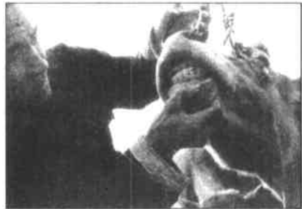
看“口岁”是经纪人的拿手戏，也决定了成交的价格，必须看个仔细。